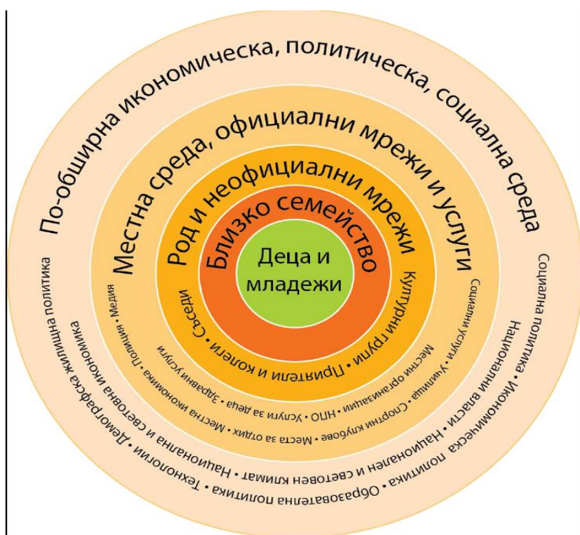
Фиг. 1 – Системи за подкрепа около децата и младежите.

Определяме младежи като лица, които са на преходната възраст между деца и възрастни. Обръщаме внимание, че ООН определя „младежи“ (предимно за статистически цели) като лицата на възраст между 15 и 24 години, като ние адаптираме нашето определение към специфичното законодателство и обстоятелства в държавите, в които работим. Независимо от определението под „младеж“ винаги се разбира лице в период на възрастта с много важни преходи, когато настъпват множество физически, когнитивни, емоционални и икономически промени.